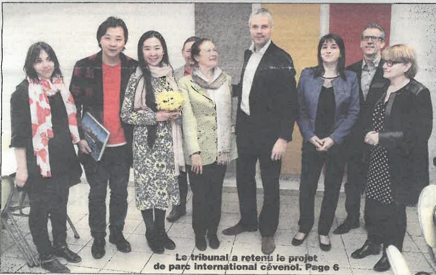
Le tribunal a retenu le projet de parc international cévenol. Page 6