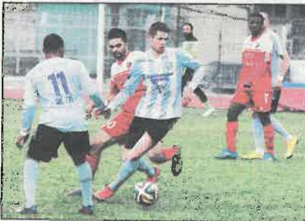
Le Puy reçoit Clermont samedi. Page 26