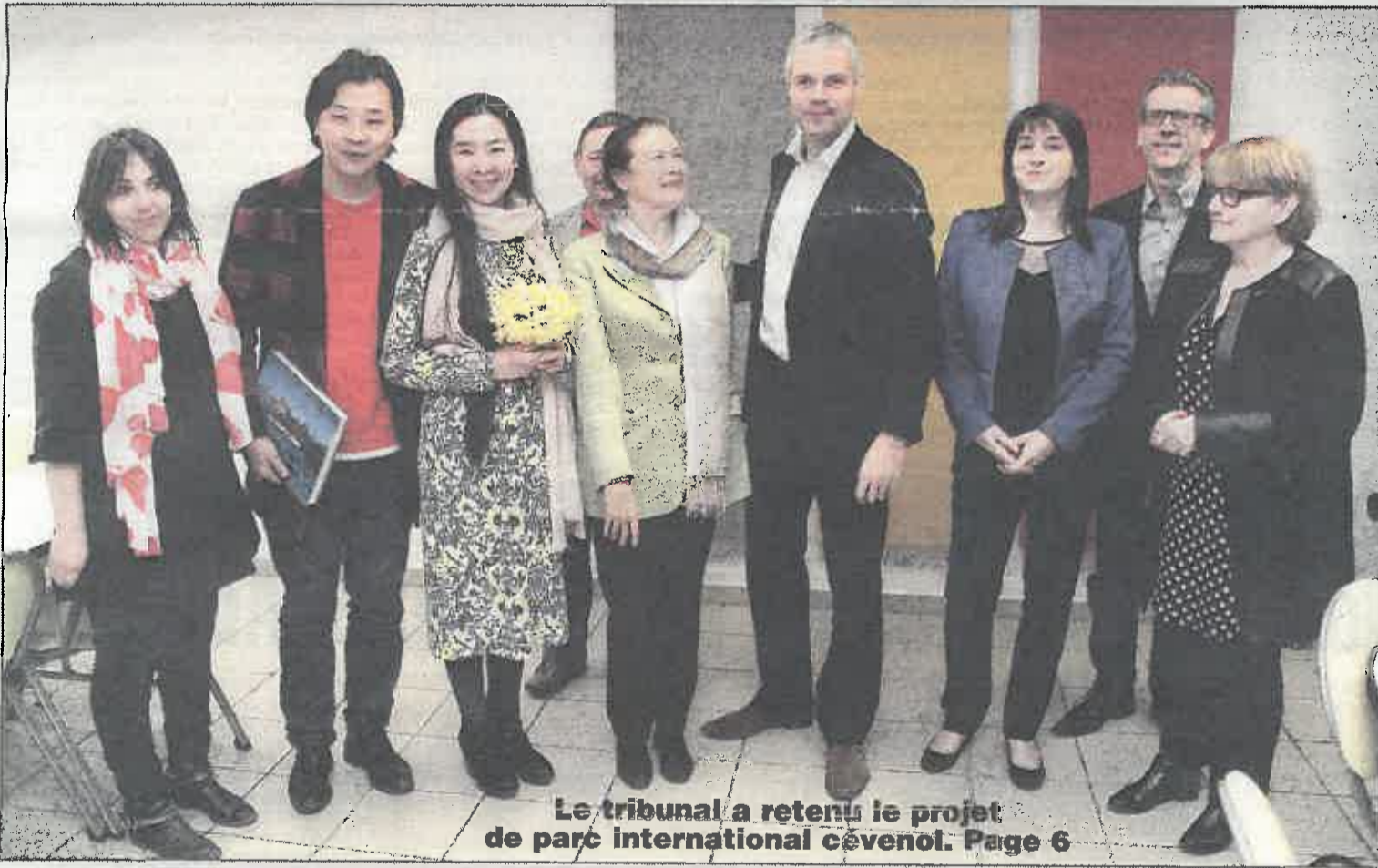
Le tribunal a retenu le projet de parc international cévenol. Page 6